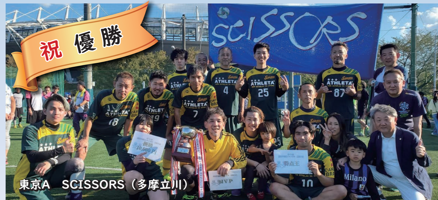
東京A SCISSORS (多摩立川)